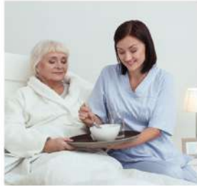
醫療照護、長照服務與銀髮健康等相關機構