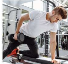
運動健身、復健、瑜珈與戶外休閒相關單位