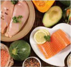
健康食品、有機與機能性飲食品牌