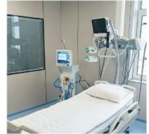
醫療科技、智慧健康與數位照護解決方案