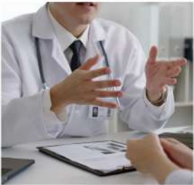
心理健康、身心療癒與壓力管理相關服務