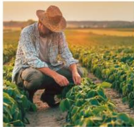
在地農業、友善土地與永續生活品牌