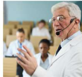
政府機關、學術單位及非營利組織