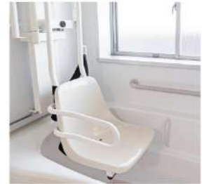
居家照護、輔具與復能設備