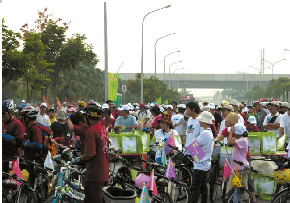
94年，台南園區環保自行車道啟用活動吸引大批人潮。