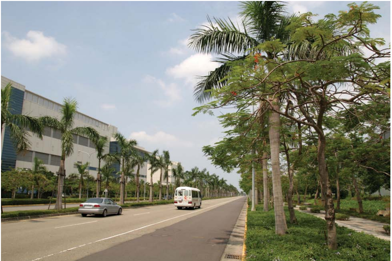
經濟與環保的對立是可以解決的，台南園區南科北路廣栽綠樹即是很好的例證。

勢。能在台南園區內瞥見成雙成對的環頸雉，在草叢內奔跑嬉戲及覓食的景象，常令愛鳥的科技人驚喜不已。97年5月24日一對白色老鷹黑翅鳶首次被觀察出現於台南園區，以二期北區之北園一路北側為活動區域，接續觀察發現有築巢，交配、繁殖等行為，並於12月4日孵化出3隻幼雛。