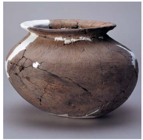
大坌坑文化繩紋陶罐。