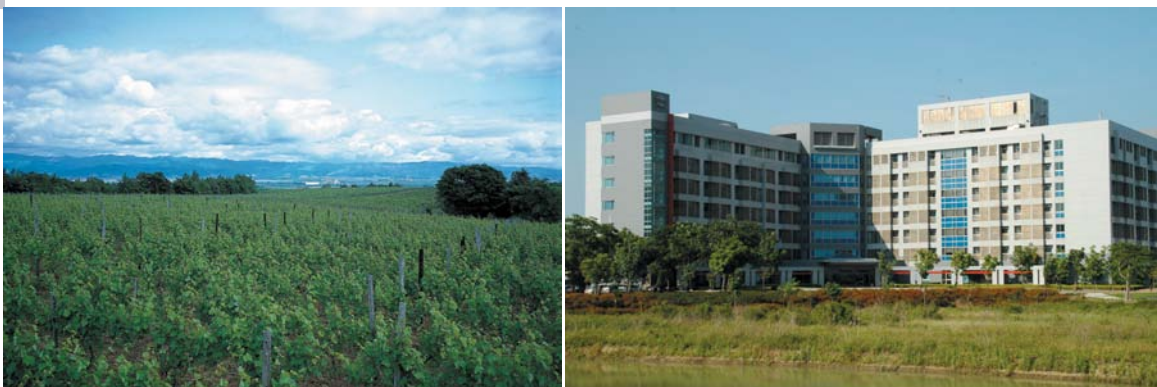
歷經長年開發，台南園區由一片荒野轉為現今的廠房林立，不變的是遍佈其中的綠意林蔭。