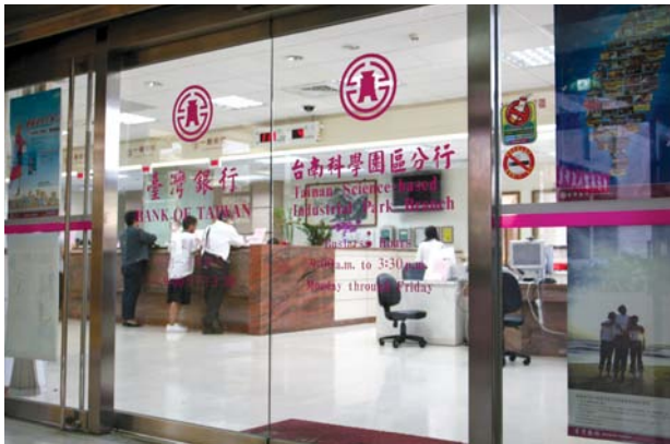
蓬勃發展的南科讓各家銀行締造良好績效，圖為台南園區台灣銀行南科分行。