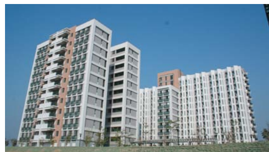
高雄園區宿舍現貌。