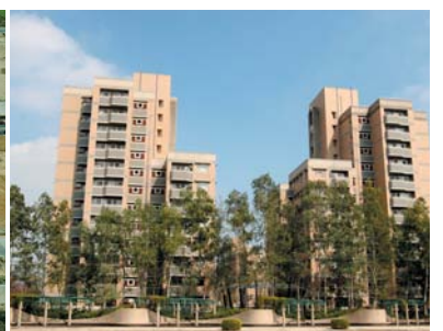
台南園區有眷宿舍98年現貌。