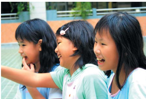
因為樹木綠美化，南科實驗中學的學子享有優質的學習空間。

得不易，且學校經費有限。南科管理局熱心提供訊息，因應廠商建廠整地之需，有些樹木將被移植到周邊各區域。呂校長得知後，積極向南科管理局爭取留給學校。於是，南科國小立刻對樹種作了一番調查，並雇工斷根，把握時效移植於校園中。這批被移植至南科國小的樹，計有茄冬樹40棵、樟樹12棵、霸王棕櫚8棵、白雞油36棵，有的已二、三十年樹齡，樹圍達30~40公分，經過5年，有的米徑已達50公分，校園綠樹成蔭，南科國小成為校齡最淺、卻擁有最老樹齡的學校。