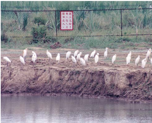
台南園區為鳥類保留一塊棲地，讓牠們得以在此停留駐足。