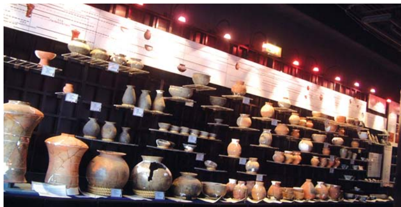
位於台南園區標準廠房二樓的考古文物陳列室。

的階段。文物搶救後續的整理、保護、保管等相關工作，在南科管理局的支持下，已提撥經費租賃一些倉庫，並有考古隊編制，進行文物清理、編號等工作，91年9月更在標準廠房二樓40坪空間裡，設置臨時性的考古文物陳列室。目前，國科