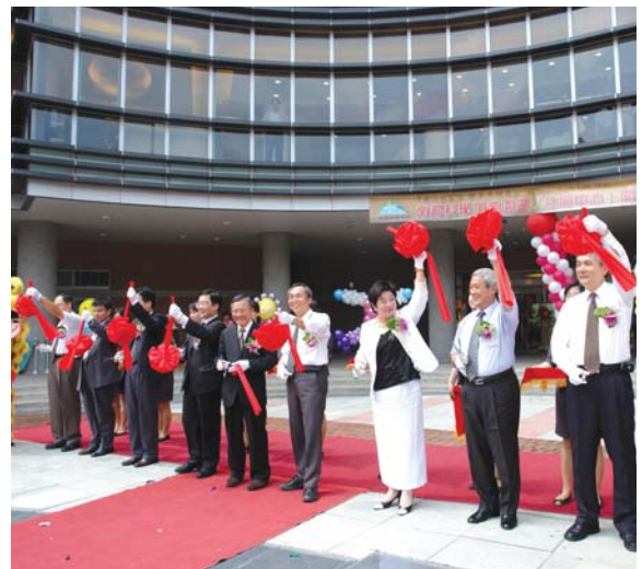
96年9月社區中心歡喜開幕，充實台南園區宿舍區的生活機能。