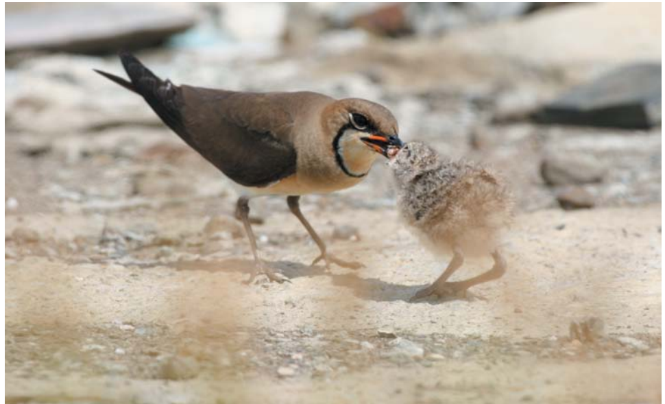
台南園區燕鴿芳蹤。