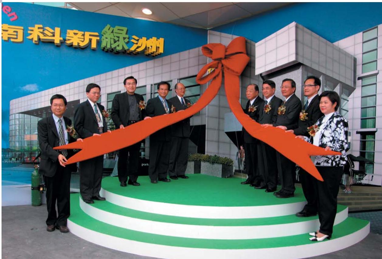
台南園區park17商場在統一集團愛鄉力挺之下，順利於92年10月開幕。