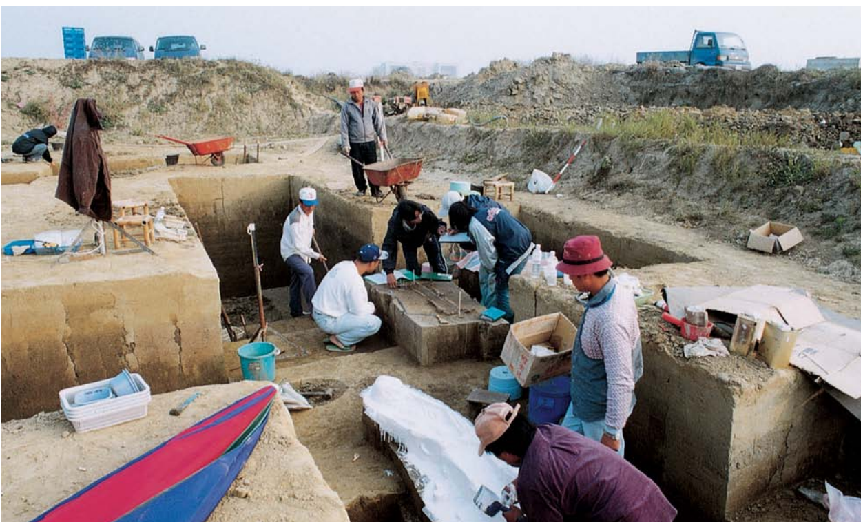
考古遺址縱橫五千年的6種文化層，連結了台灣意識。