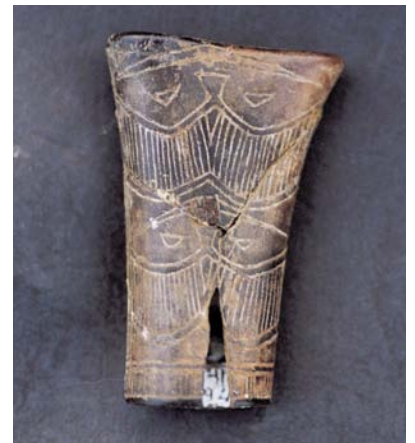
蔦松文化刻劃鹿角刀柄。