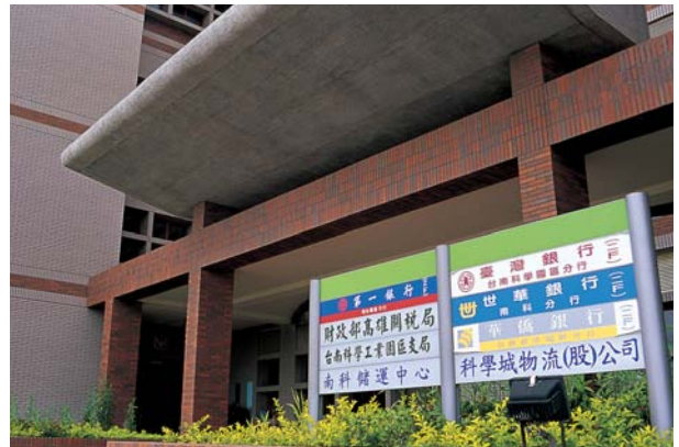
服務業者的進駐，對提昇台南園區生活機能有著很大的助益。

樂外，為廠商提供快速、便捷的工商服務，也是南科管理局服務效能的一大指標。進駐南科的高科技產業，不論積體電路或光電廠商，建廠速度快，均需籌措大量資金，銀行進駐園區，為廠商就近服務，是再好不過的事。