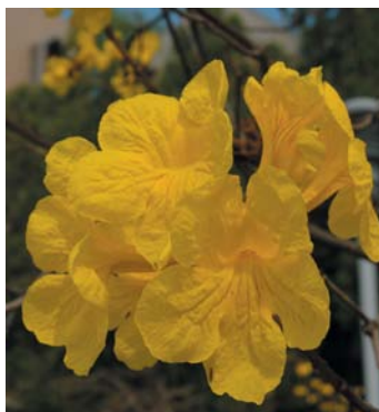
台南園區內的美麗植物—黃金風鈴木（左）、紫花霍香薊（右）。