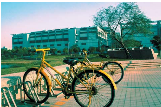
曾風行台南園區的愛心「小黃」自行車是方便的短程代步工具。