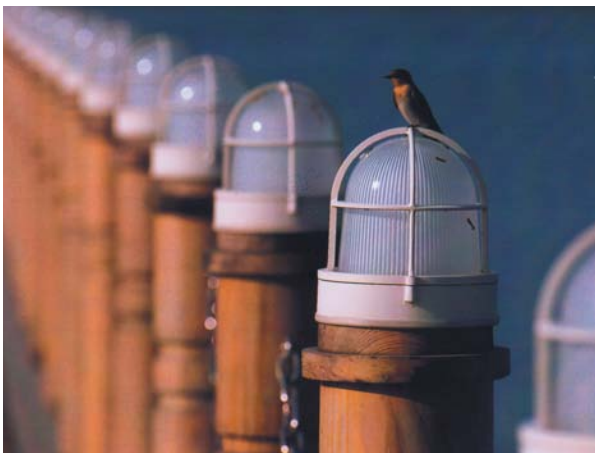
嬌小可愛的鳥類，在台南園區處處可見。