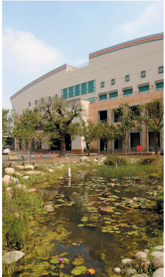
南科實驗中學國小部綠意盎然的校景一隅。

進駐，並培育下一代優秀人才投入科技產業，南科管理局開始積極推動國立實驗中學。當時的國科會主委陳建仁表示，至2010年北中南三個科學園區產值將達全國1/3，且創新研發人才是園區永續發展的基礎，有必要成立實驗中學，為園區廠商的子女提供良好的教育機會，是很值得投資的事業，竹