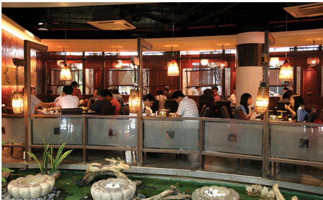
台南園區park17商場內的桃花源餐廳，用餐環境舒適，頗受南科人歡迎。