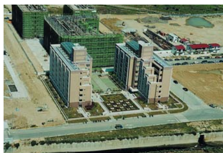
台南園區單身宿舍興建時一景。

讀：「南台灣房價不高，對於年輕人來說『租不如買』。如果南科人因而去買周邊的房子，繁榮地方，我也樂觀其成。」畢竟繁榮地方，也是科學園區成立的主要目的之一。