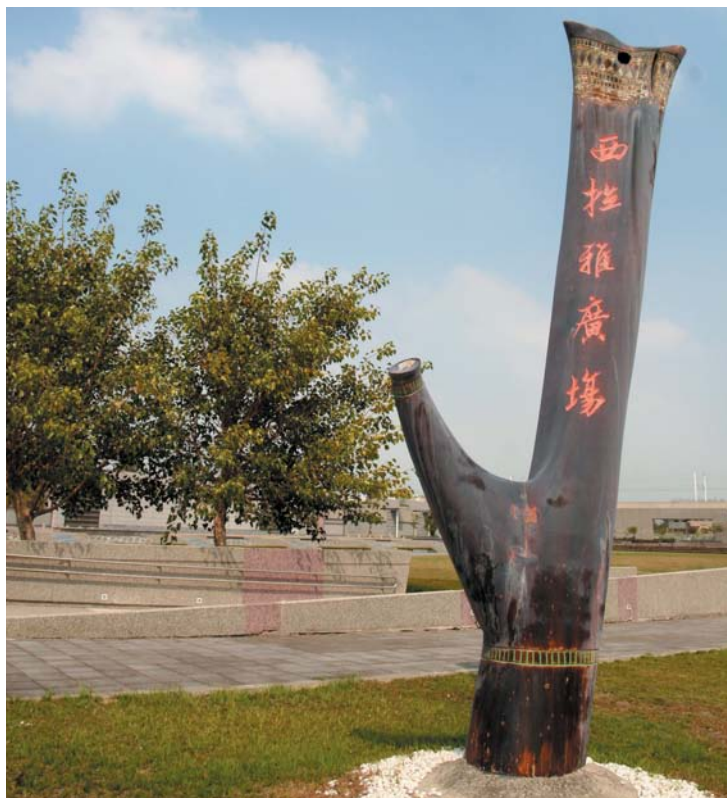
西拉雅廣場一隅，右方為西拉雅文化帶刻劃紋穿孔鹿角飾品。