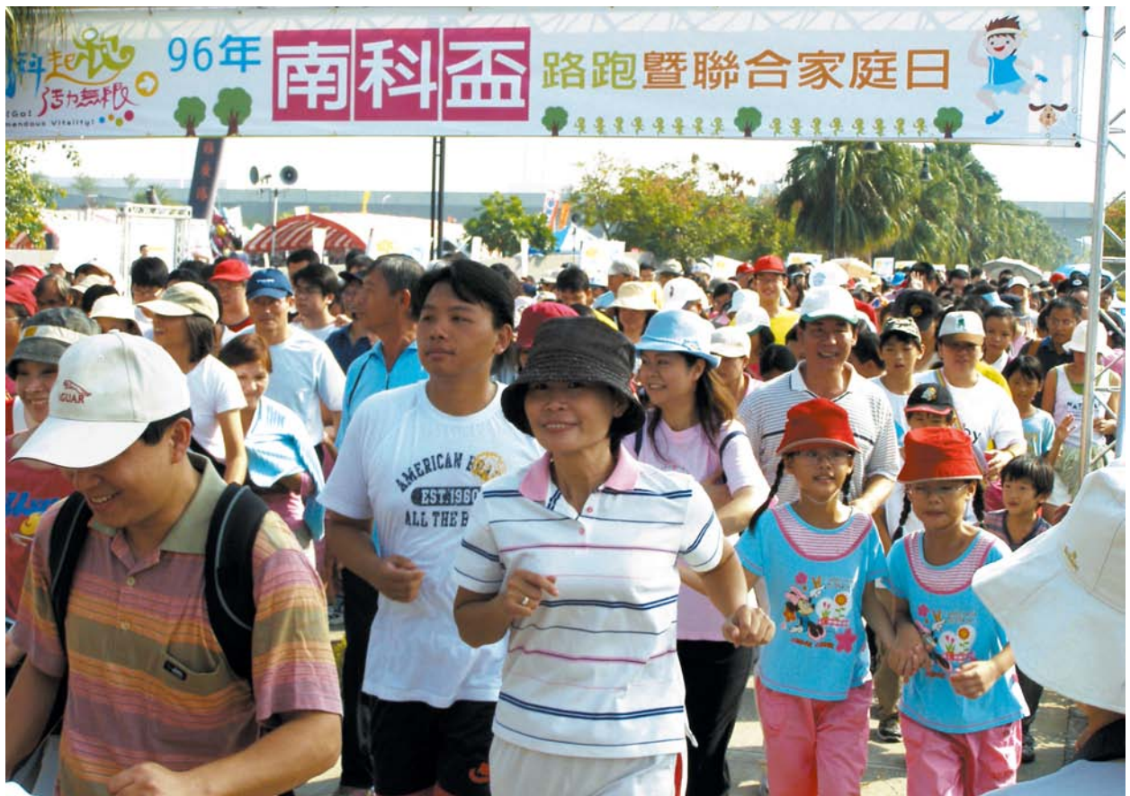
台南園區生活豐富有趣，圖為96年10月28日南科盃路跑暨聯合家庭日。