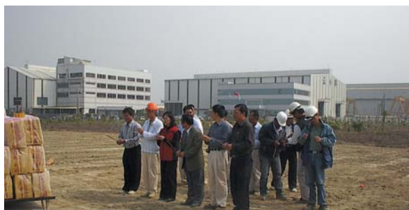
93年3月15日高雄園區第一期住宅區開發工程開工動土。