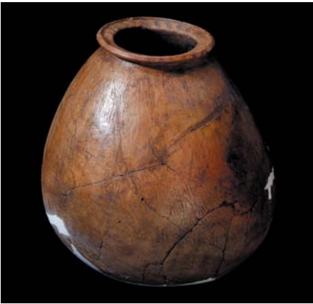
大盆坑文化刻劃帶彩陶瓶。

說、溝通，科學園區的科技人開始認同文化遺跡的價值。在南科這塊土地上，因為科技人學會尊重文化，科技與文化便產生了對話，甚至激起了共鳴。