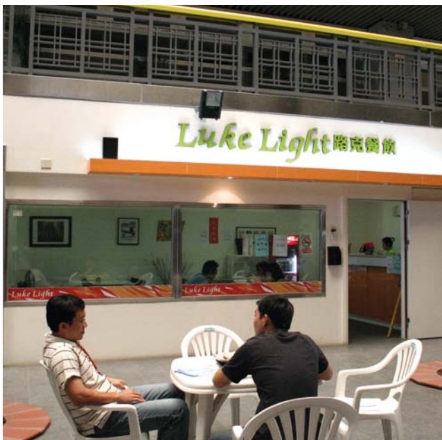
位於高雄園區標準廠房的路克餐廳是高雄園區從業人員用餐的好去處。