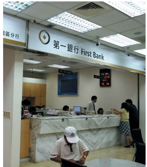
第一銀行南科分行98年一景。