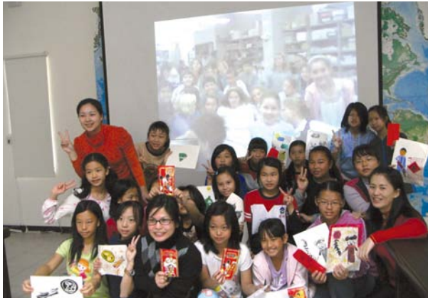
南科實驗中學與國外學校視訊的情景。