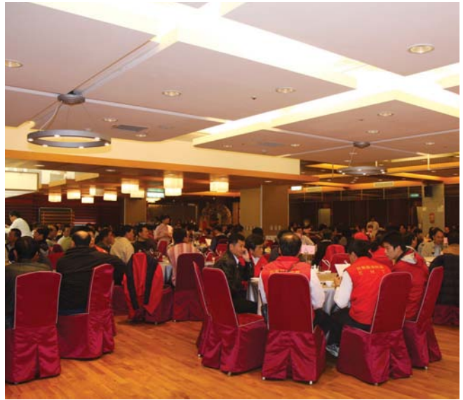
在台南地區享有盛名的總理大餐廳，內部裝潢高雅華麗。

質餐飲環境，南科管理局於97年2月，於商務會館1樓引進在台南市相當著名的總理大餐廳，提供南科人就近品嚐美味正宗湘、粵菜，若廠商有需求，雞尾酒會、自助式餐會也是總理大餐廳可提供的客製服務。