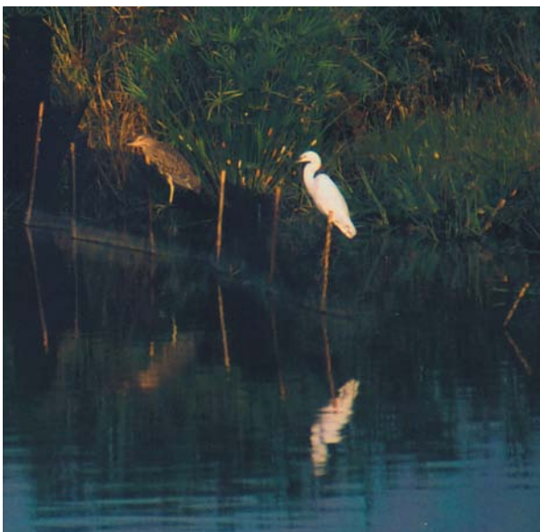
滯洪池同時也是鳥類的棲息地，定心觀察，驚喜俯拾皆是。

境，南科管理局自90年委託台南市野鳥學會進行生態調查，迄今已持續9個年頭。此外，台南園區內大量種植蜜源植物，滯洪池設立後，蝶類與蜻蛉類等陸生昆蟲已明顯增加。