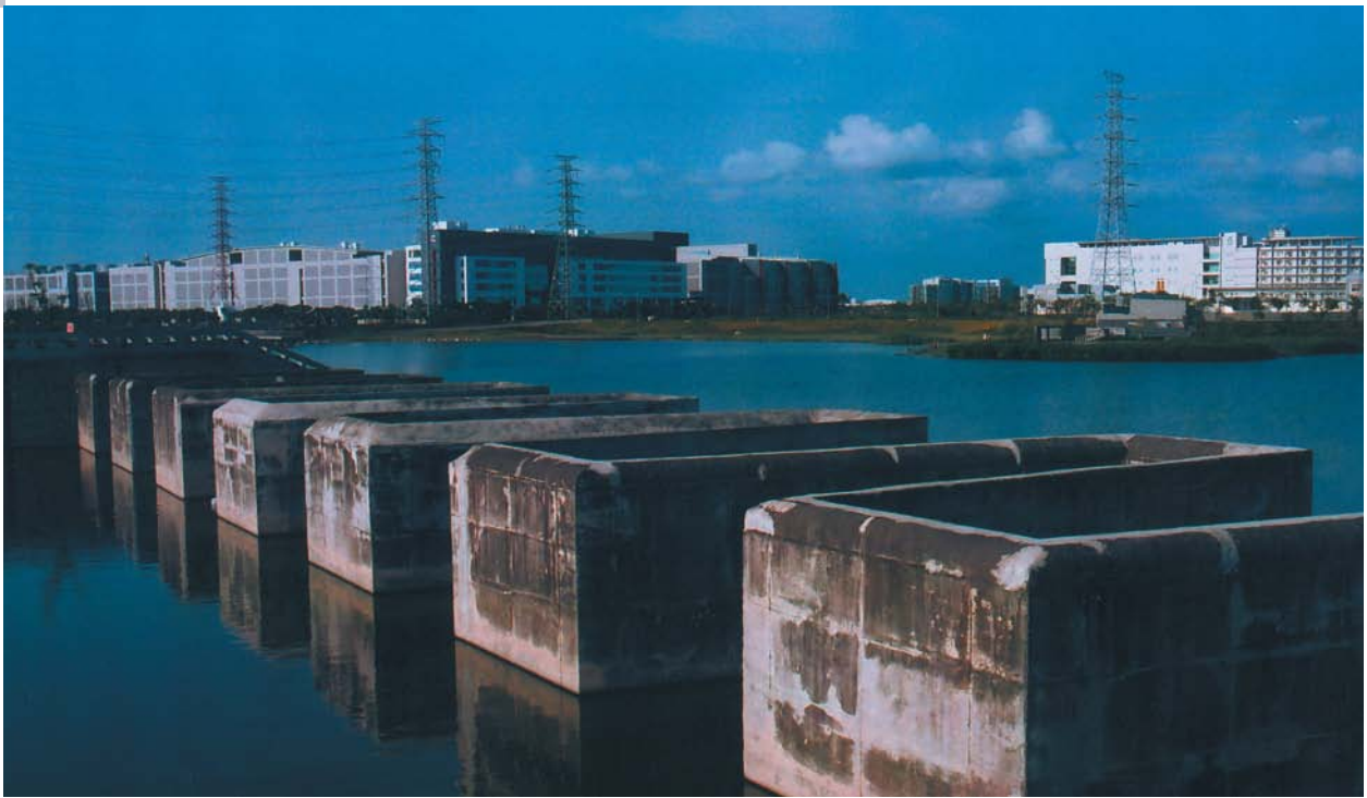
台南園區的滯洪池有巨型水壩之美。