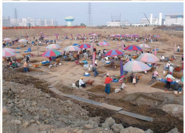
工程建廠的「快」和遺址挖掘的「慢」，形成微妙的對比與平衡。