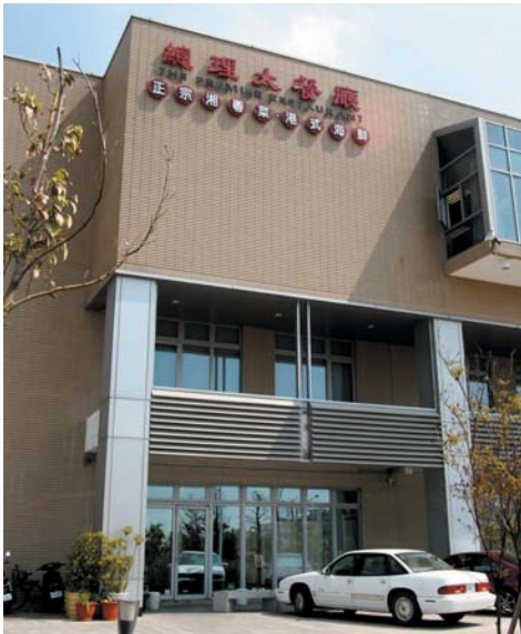
總理大餐廳於97年2月進駐台南園區商務會館1樓。