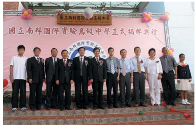
95年南科實驗中學舉行揭牌儀式。