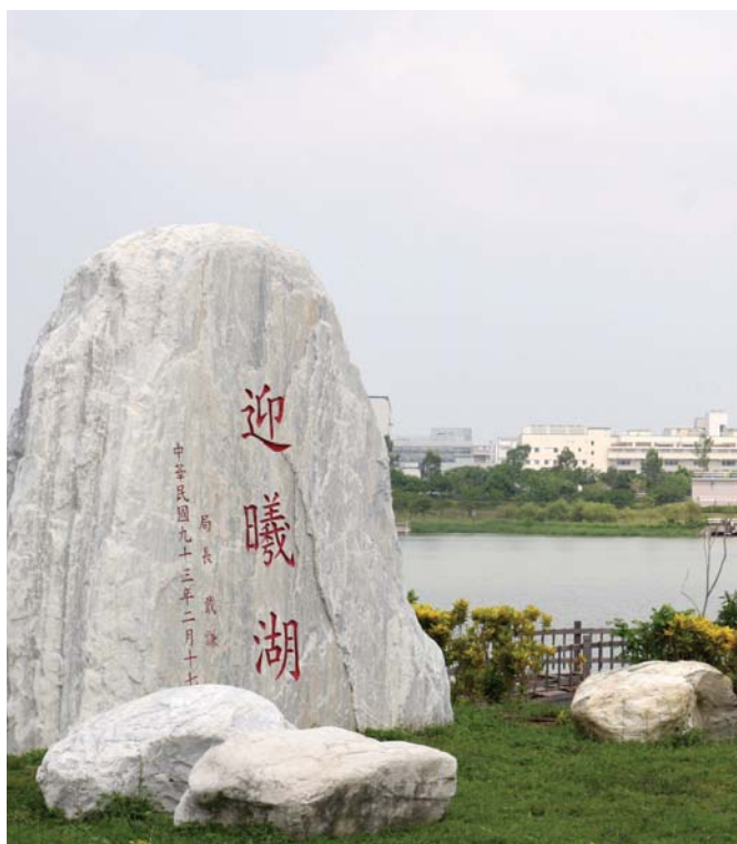
兼具社區公園功能的台南園區迎曦湖石碑。

此外，迎曦、霞客、道爺3湖之碼頭區域，93年12月1日開放申請釣魚，但為維持釣魚休閒品質，南科管理局採取總量管制，釣客得先提出垂釣申請，經核發釣魚證，發給釣魚背心，才能享受垂釣之樂。