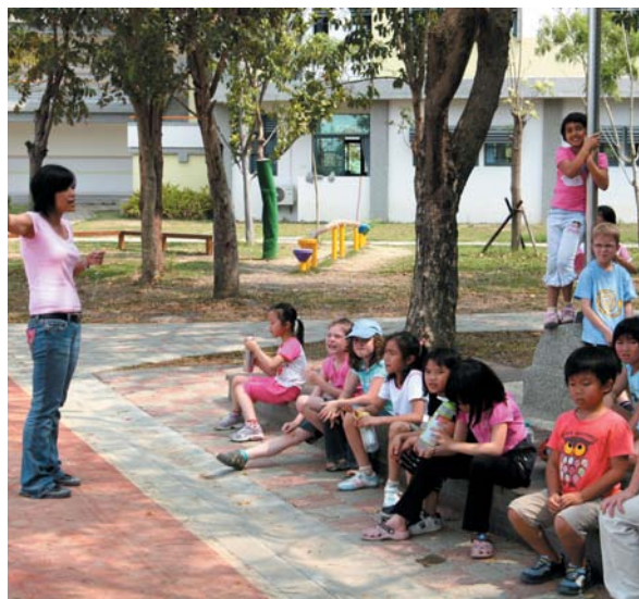
為兼顧園區外商子女的教育，南科實驗中學雙語班應運而生。

官？」「教育部部長態度如何？」「人事行政局給不給教師員額？」「主計處同意付錢嗎？」「如何從台南縣政府手中接辦？」「南科有能力辦學嗎？」諸多關鍵問題糾葛，在在考驗著南科管理局的經辦能力，令人欣慰的是，這些問題都有了圓滿的結局。