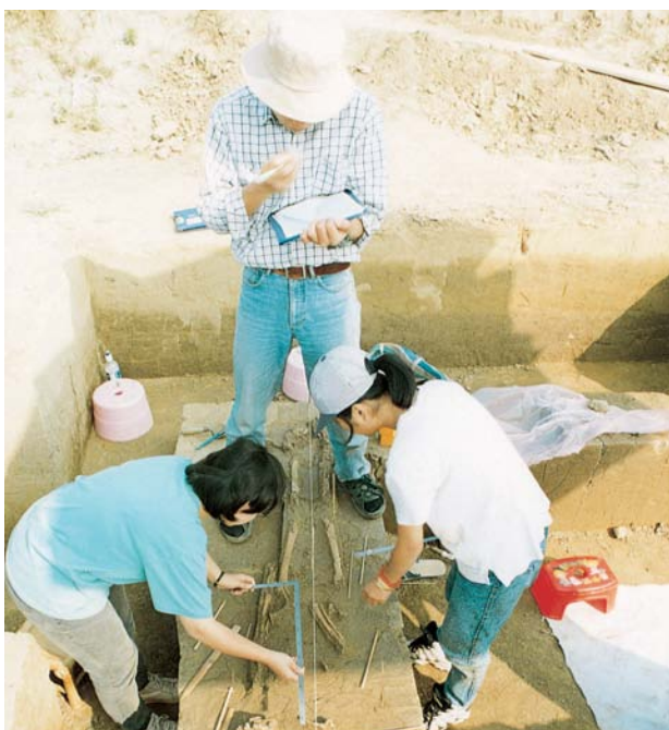
台南園區考古作業現場。

處解決問題的能力。85年，南科籌備處與台南縣政府文化局、專家學者會勘，並研議日後處理的因應方案。儘管事前多加準備，在實質作業上仍舊面臨許多挑戰。85年7月1日，台南園區各項開發工程積極展開，其中南側道路就因發現遺址而被迫停工，一度呈現落後的現象。