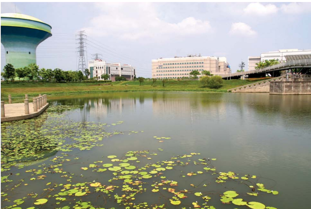
廠房和滯洪池互相輝映的情景四處可見。

然而，地草長得飛快，也不全然是負面的影響。一直生活在保護區的環頸雉，反因為雜草的庇蔭，造就了更有利的棲息條件。自90年4月起，受南科管理局委託監測的台南市野鳥學會發現，在保護區活動的台灣特有亞種環頸雉有增多的趨