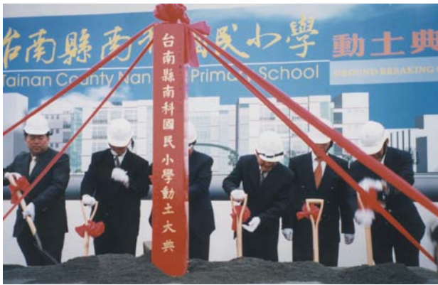
89年南科國小舉行動土典禮，替南科教育基能打下最初的根基。