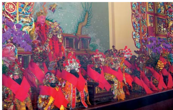
新港堂眾神合署辦公，成為台南園區另類文化特色。

在寺廟執事指引下，南科籌備處行禮如儀，焚杯請示神明，領得「可也」的神諭。後來，另加上南科特定區內樹谷園區的3間廟，共有13間廟