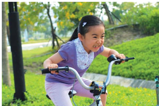
騎自行車已在台南園區內形成一股風潮。