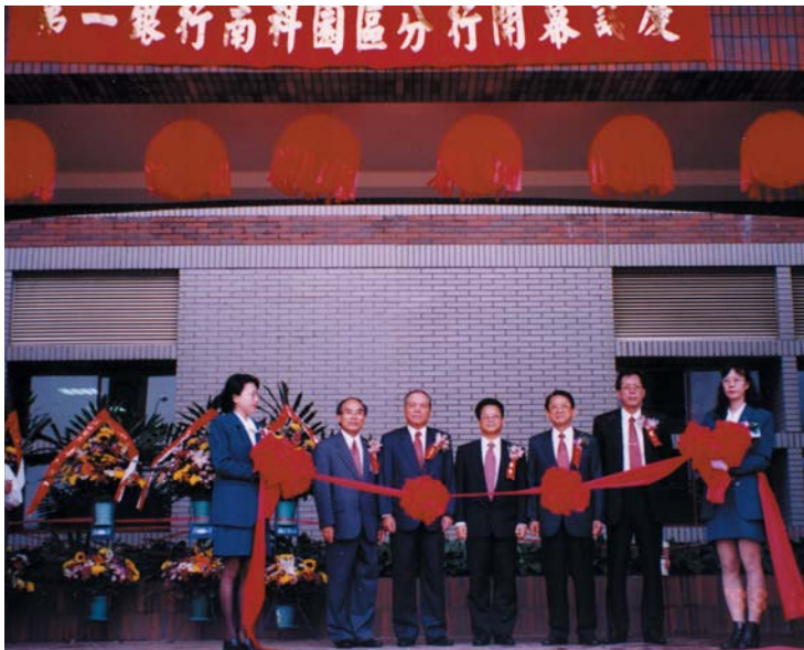
87年第一銀行南科分行於台南園區開幕情景。