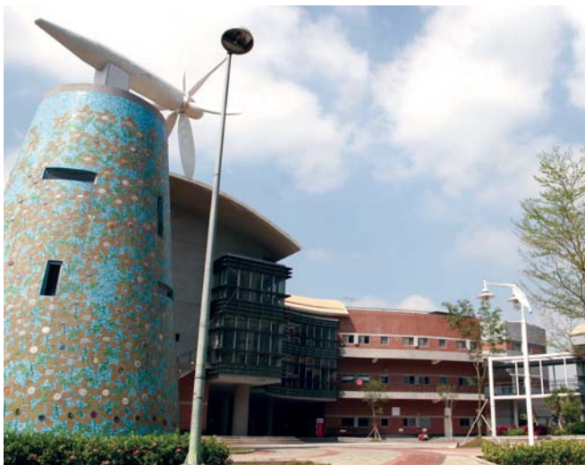
位於台南園區社區中心的馬賽克風車塔。

97年5月1日，正式營運的健康生活館，為台南園區生活再添新貌。兼具SPA游泳館、多功能體育館、運動養生館3館建築合一的健康生活館，是