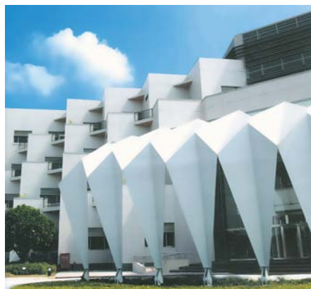
台達電位於台南園區的綠建築廠房獲得高度評價。

水的重任，更以摺版造型，以「水」及「財富」的含意，呈現出元寶的厚實地標性及門戶感。而98年8月即將完成的南入口意向設計，則將園區內的景觀打造得更藝術化。