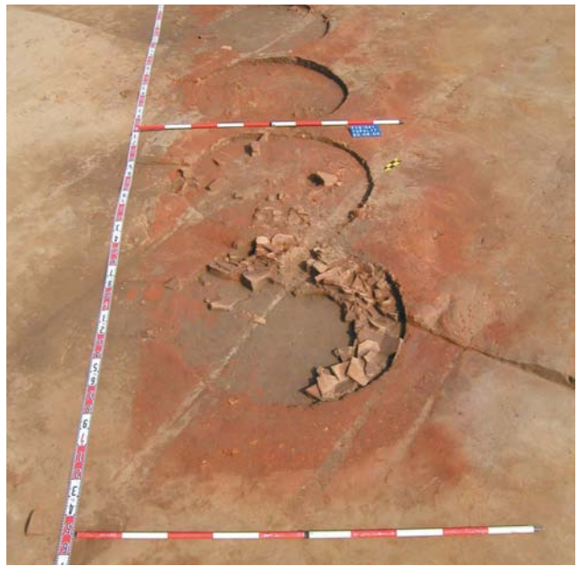
不斷摸索下，南科考古隊已建立處理文物的SOP。

現在，台南園區出土的文物，已化身為南科管理局製作外賓紀念品最佳的創意來源，更是外賓參訪南科的必訪焦點。這個科技與文化和平共存的科學園區文化層，數百、千年後，也將成為後世子孫另一值得驕傲的文化資產。