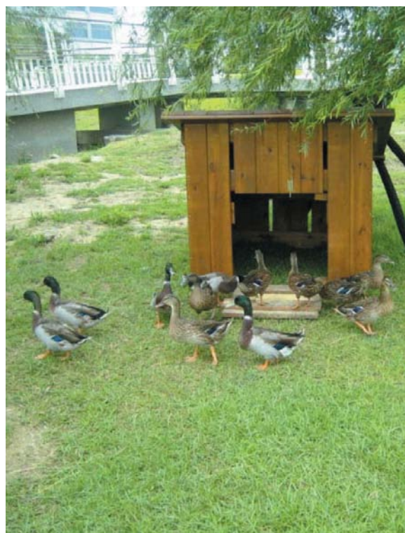
悠遊台南園區道爺湖畔的綠頭鴨。