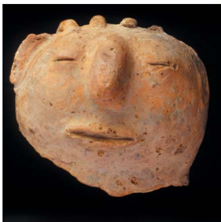
蔦松文化紅褐色泥質人面陶偶。