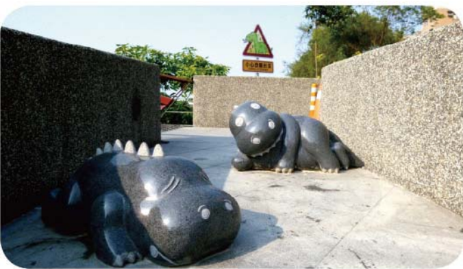
▲ 大洲排水人行橋-創意裝置藝術竣工