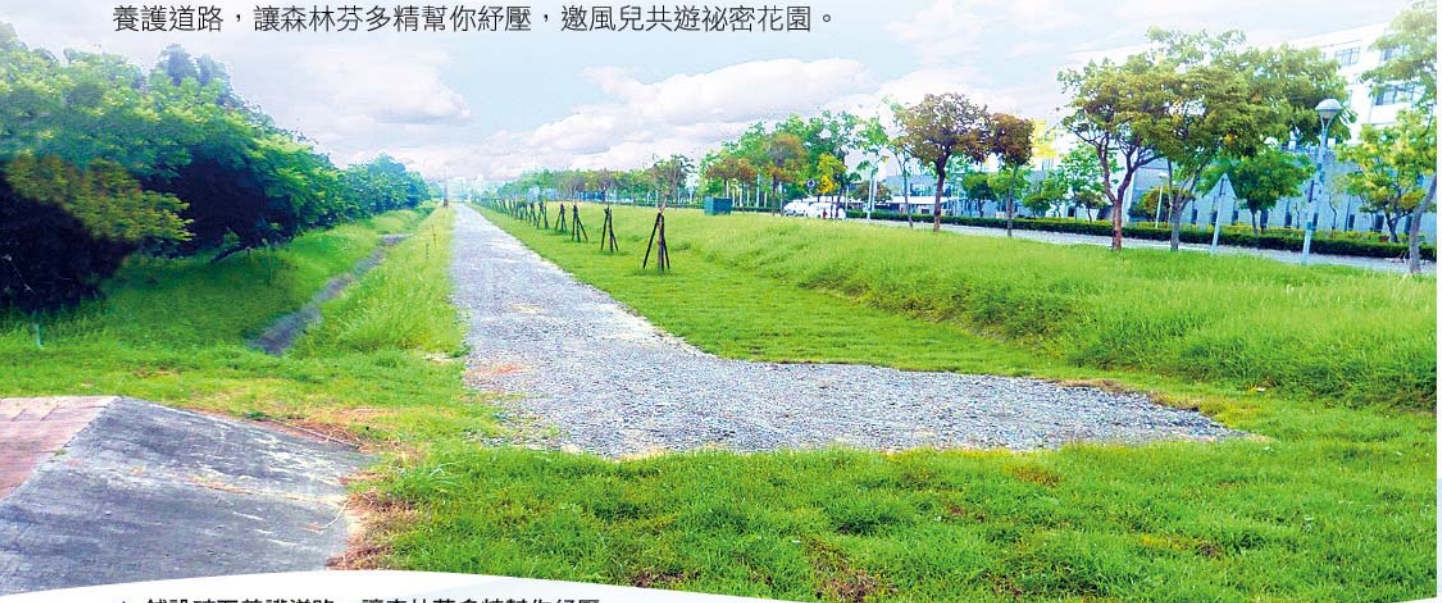
▲ 鋪設碎石養護道路，讓森林芬多精幫你紓壓

此外南科管理局種植多樣性原生生態小苗，營造鳥類、昆蟲及小型動物的生態棲息樂園，同時鋪設碎石養護道路，讓森林芬多精幫你紓壓，邀風兒共遊祕密花園。