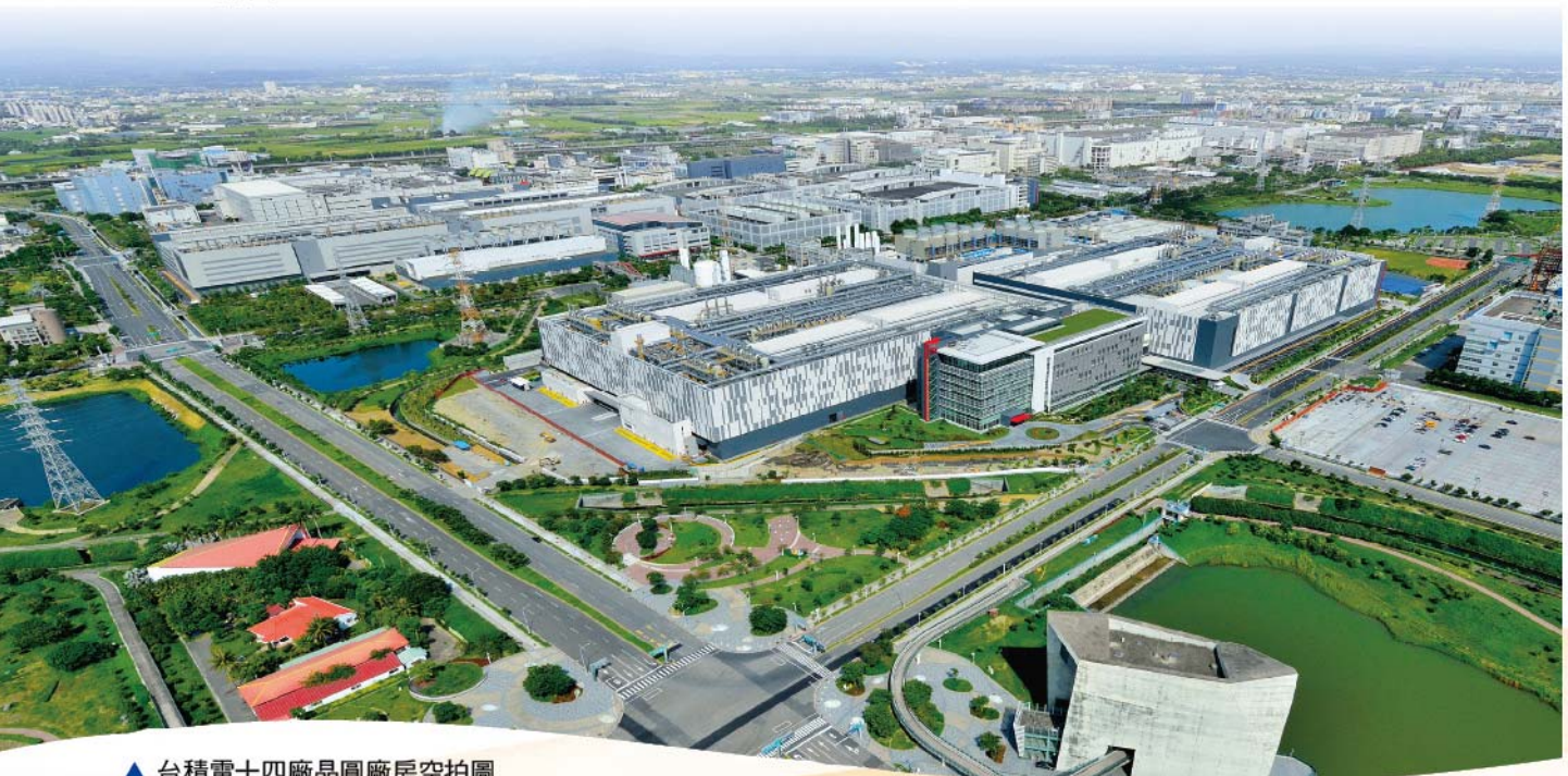
▲ 台積電十四廠晶圓廠房空拍圖

台積電公司於台南園區14廠第5-7期投入20奈米以下之製程，陸續投資5,000億元以上。第5-7期及先進封裝廠已量產。聯電公司於台南園區FAB 12A第5、6期廠房投入28奈米以下製程，第5期並於今年裝機，陸續投資2,400億元以上。二晶圓大廠加碼投資，除帶動周邊上下游產業投資進駐，並促使南科成為全球最大的12吋晶圓專工基地。