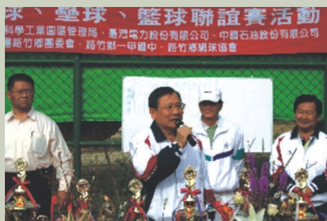
近隣市民との親睦競技大会開幕式(12月25日)